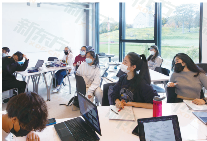
疫情下北野山中学的课堂现状

在疫情期间，为了保证学生健康，学校制定了严格且严谨的管理规定，但同时也尽力维持学生的校园生活和活动体验。在疫情暴发之初，学校要求学生上课必须戴口罩，限制访客，假期时为不能够回国的国际学生开放宿舍但要求他们不能离开学校以降低感染风险等，这些措施一直沿用至今，让学生及家长增添了一份安全感。